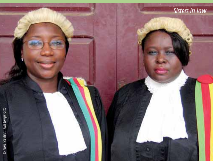
Sisters in law