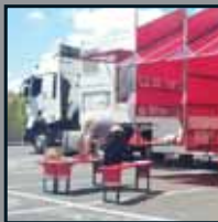
Le MUMO 2