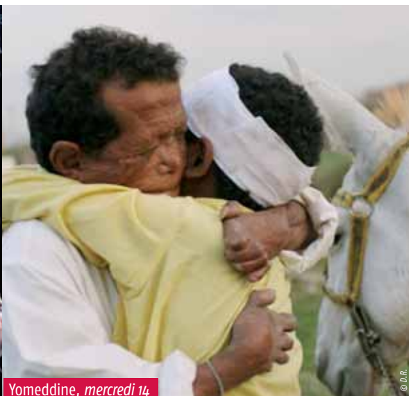
Yomeddine, mercredi 14