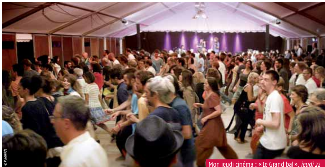
Mon jeudi cinéma : « Le Grand bal », jeudi 22