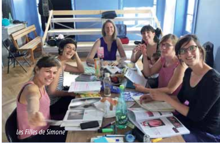
Les Filles de Simone

Vendredi 30 et samedi 1 er décembre à 20h30 au centre Jean-Vilar – Entrée libre. r Réservation au 01 48 85 41 20