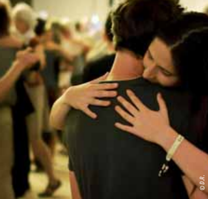
Le Grand bal