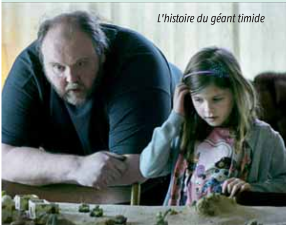
L'histoire du géant timide