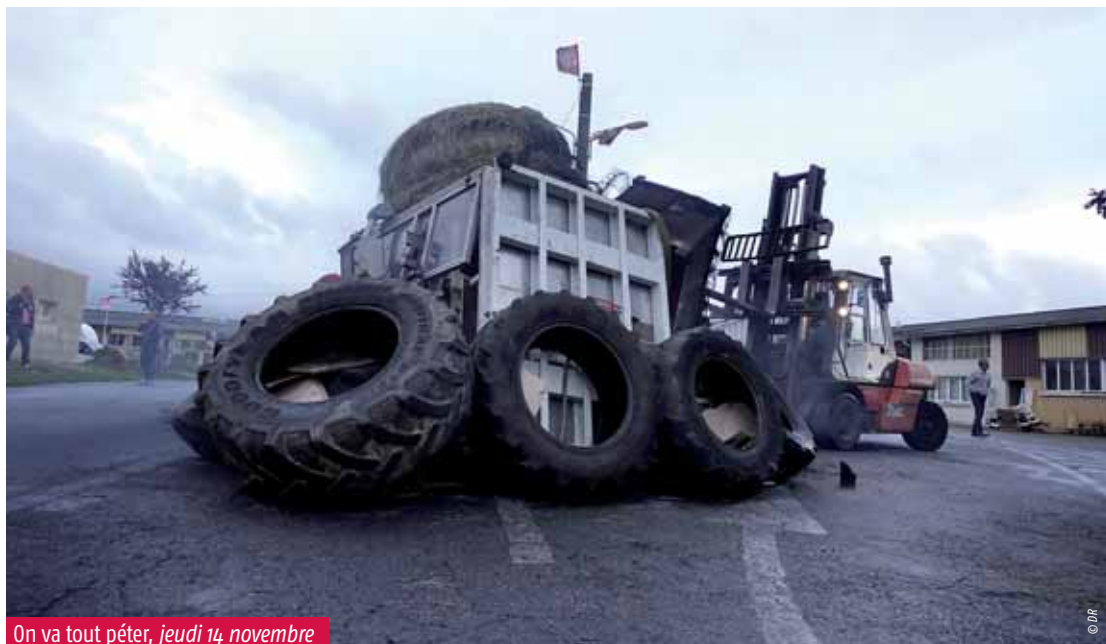
On va tout péter, jeudi 14 novembre