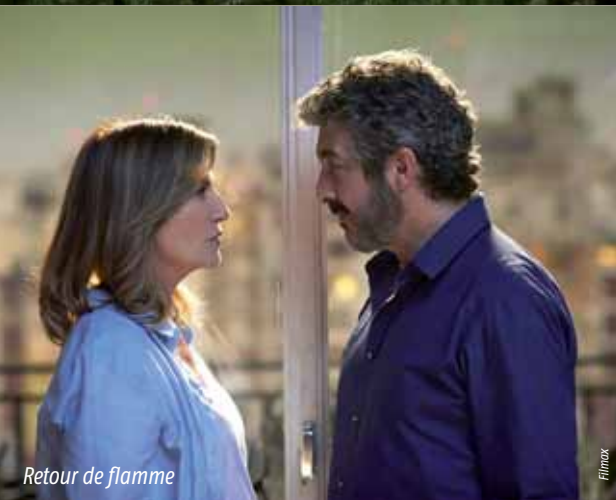
Retour de flamme