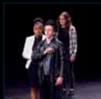
Tous en scène