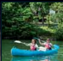
Balade en kayak