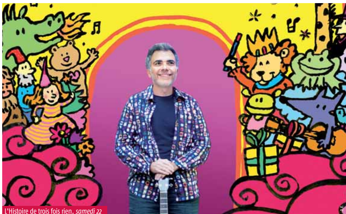
L'Histoire de trois fois rien, samedi 22