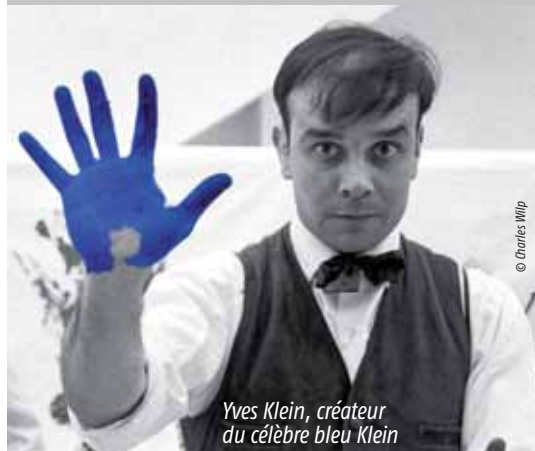
Yves Klein, créateur du célèbre bleu Klein

à la Maison des arts plastiques Infos et inscription au 01 45 16 07 90 ; ecole.artsplastiques@mairie-champigny.fr . Tarifs selon le quotient familial