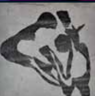
Les Samedis de l'art