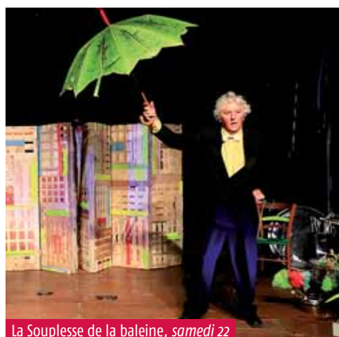
La Souplesse de la baleine, samedi 22