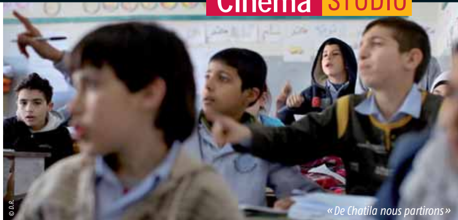
« De Chatila nous partirons »