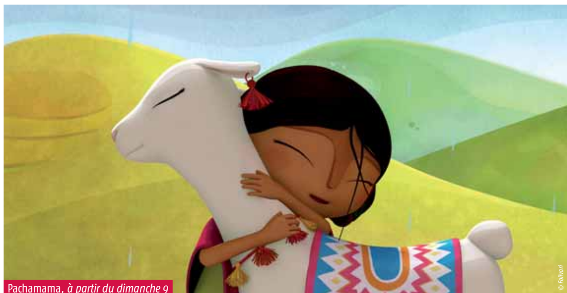
Pachamama, à partir du dimanche 9