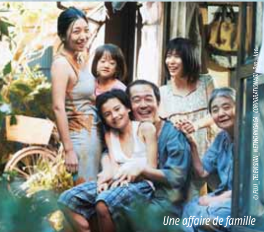
Une affaire de famille