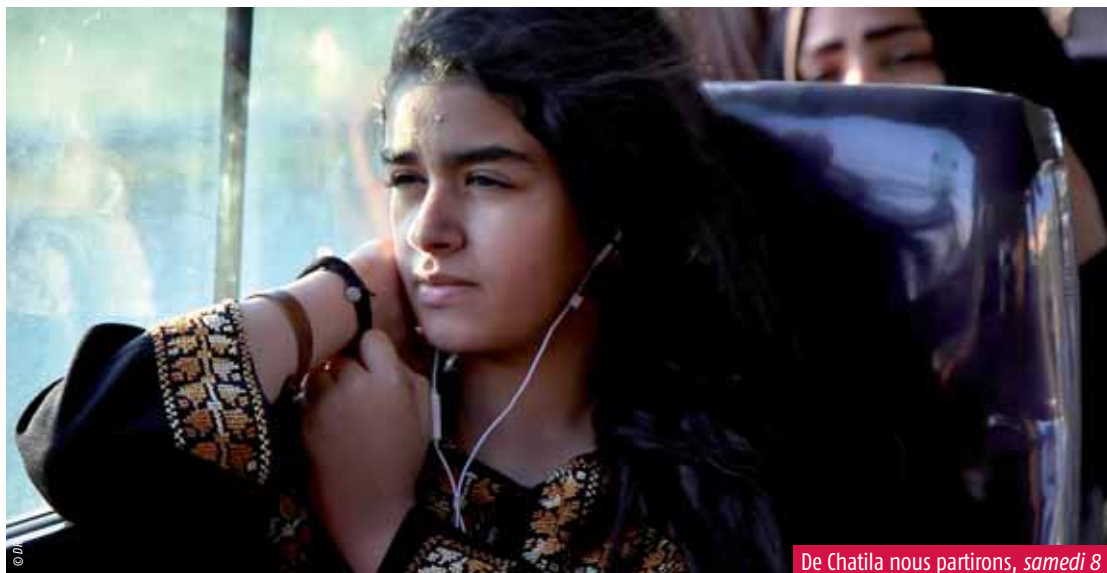
De Chatila nous partirons, samedi 8